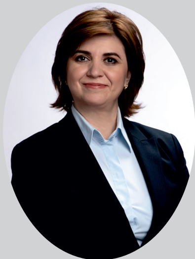
MONICA CRISTINA ANISIE Ministrul Educației și Cercetării